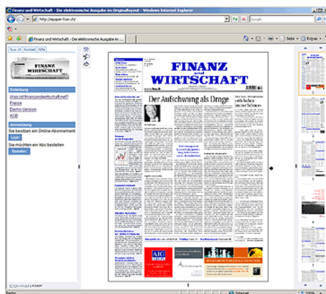
Titelseite der «Finanz und Wirtschaft» als E-Paper

Selbstverständlich stehen die Zeitungsausgaben auch als E-Paper zur Verfügung. Diese Applikation wird von einem Drittanbieter betrieben, ist jedoch direkt an die fuw.ch Plattform gekoppelt. Sämtliche Logins und Bestellungen aus der E-Paper Lösung werden in der auf icms basierten FuW-Plattform verifiziert. Onlinebestellungen werden via SAP-Rechnungs- oder Kreditkarten-Schnittstelle beglichen und nach erfolgreicher Transaktion via icms freigeschaltet. Damit basieren beide Webplattformen – das Investment Cockpit der Zeitung wie auch die E-Paper Lösung – auf der selben icms Benutzerverwaltung.