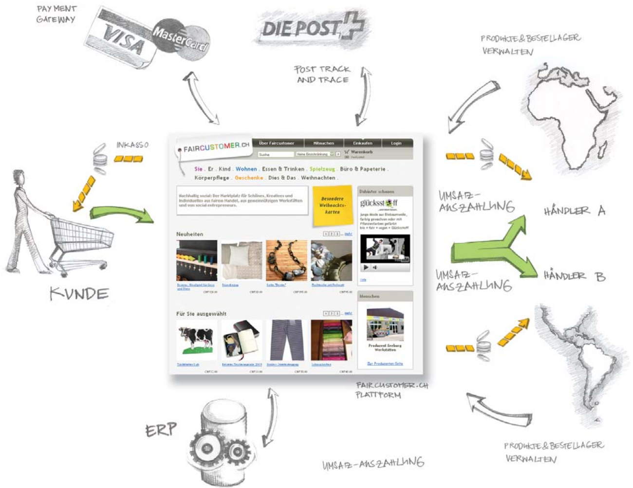
Involvierte Systeme und Parteien bei Faircustomer.ch