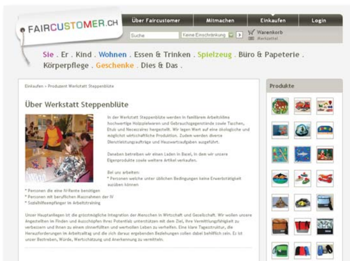
Information zum Hersteller, dem sozialen Hintergrund und die Übersicht über all seine Produkte

Eindrücke vom Anbieter und seinen Produkten runden das vertrauensbildende Storytelling ab. Zusätzlich kann über den Händlernachweis das gesamte Sortiment eines Anbieters abgerufen werden, das auf dem Marktplatz von Faircustomer AG erhältlich ist.